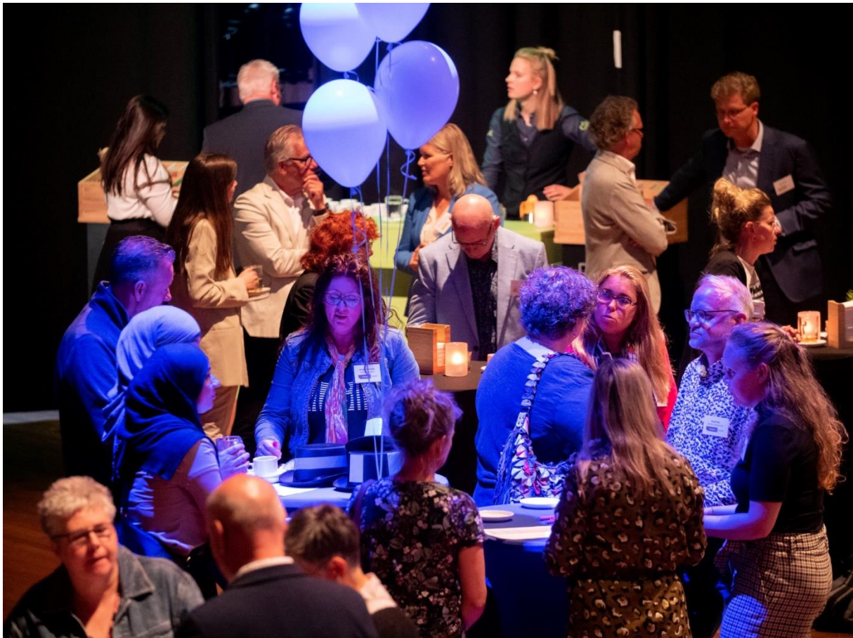
Bedrijven en maatschappelijke organisaties druk aan het matches

Resultaat: € 47.000,00 aan maatschappelijke matches.