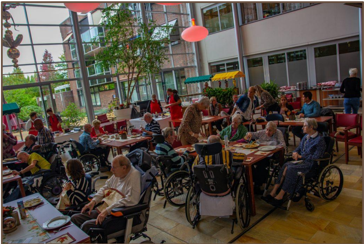
De ouderen genoten van versgebakken pannenkoeken

Op vrijdag 7 oktober is het de Nationale Ouderendag en ook dit jaar zet AssenvoorAssen zich niet alleen deze dag, maar de hele week, in om ouderen in het zonnetje te zetten. De Nationale Ouderendag is een initiatief van het Nationaal Ouderenfonds en wordt ieder jaar gehouden op de eerste vrijdag van oktober. 5 jaar geleden sloot AssenvoorAssen zich bij dit initiatief aan om de ouderen uit Assen en de regio een week lang in het zonnetje te zetten, en met succes. We organiseren al 5 jaar lang een leuk en gevarieerd programma voor de ouderen en ieder jaar sluiten er steeds meer organisaties en bedrijven aan om te helpen. En ook dit jaar hadden we weer een heel gevarieerd programma met onder andere een Seniorenbeurs en het bakken van pannenkoeken.